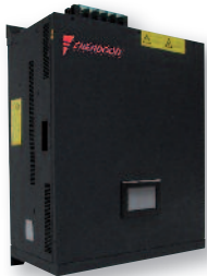
FINSVG.(030 - 100)